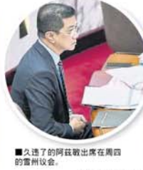
■ 久违了的阿兹敏出席在周四的雷州议会。