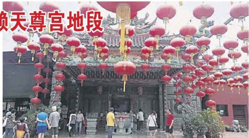
天尊宫获刘蝶集团捐赠一幅 753 平方尺的土地。

仁强、刘蝶集团产业策划副经理王永威、天尊宫顾问拿督黄添来、名誉主席拿督斯里江德发、詹庆强、总务陈金喜、财