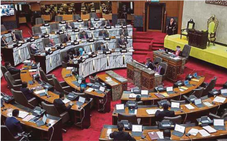
Persidangan Penggal Kedua Dewan Undangan Negeri Selangor Ke-14 Tahun 2019 di Bangunan Dewan Negeri Selangor, Shah Alam, semalam.