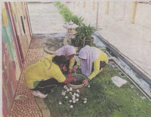
Filepic of students in various Klang schools being taught to identify potential Aedes breeding sites and how to eliminate the problem, and (right) a Kajang Municipal Council Health and Environment officer showing a bottle containing larvae found at a residential premises.

gue cases increased by 200% in the same corresponding period compared to last year.