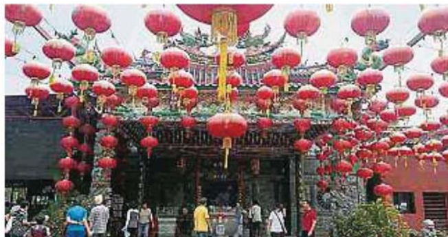
天尊宫获得刘蝶集团捐赠753平方尺的土地。