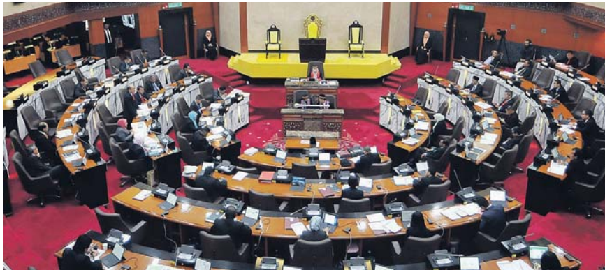
Semua ADUN perlu mematuhi etika pemakaian yang ditetapkan sepanjang Sidang DUN berlangsung.

Beliau berkata, pihaknya tidak menyangka te-