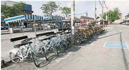
骑脚车是许多到访耕作的游客，最热爱的休闲活动之一。(档案照)

她也提及，巴生市区近期还会再新增一些脚车路线，州政府也会继续进行类似的推广，鼓励脚车运动。